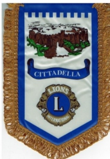
Lions Club Cittadella